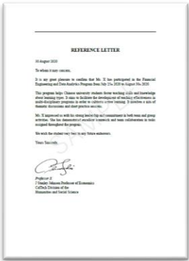
学员推荐证明信(示例)