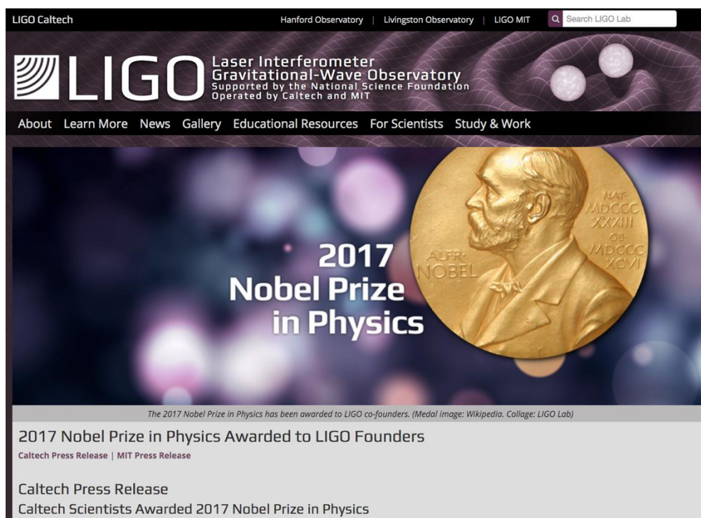
(2017 年诺贝尔物理学奖颁给引力波探测 LIGO 科学联盟)

2016 年 2 月 11 日，科研人员宣布激光干涉引力波观测站（LIGO）于 2015 年 9 月首次探测到引力波。该消息震惊世界，堪称科学史上的里程碑，学界甚至公众舆论都因此掀起一股热潮。引力波被称为“时空的涟漪”，探测引力波是一种全新的天文观测手段，是对 广义相对论和黑洞理论 的直接验证。爱因斯坦在广义相对论预言了引力波的存在：这是一种以光速传播的时空波动，是时空曲率的扰动以行进波的形式向外传递的一种方式。自从引力波被提出，人类探索它的努力就从未停止。20 世纪年代，对于脉冲星（或称波霎）双星系统 PSR1913+16 的观测间接证实了引力波的存在；90 年代起，美国启动 LIGO 计划；到 2015 年，第二代 LIGO 干涉仪成功观测到两个黑洞合并的引力波，也是首个距离地球 13 亿光年的引力波源 GW150914。